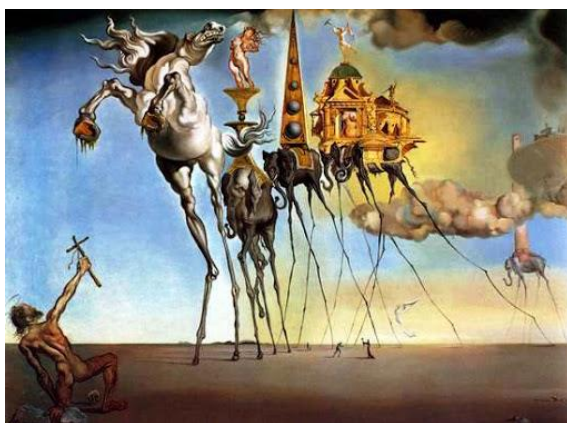
Surrealismo, Salvador Dali.

Usando a imagem como inspiração, crie uma obra Surrealista, com elementos do sonho, que não fazem parte da nossa realidade.