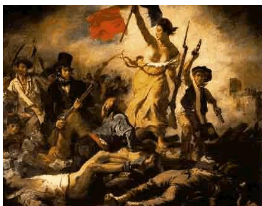
Liberdade guiando o povo, Eugène Delacroix. (Obra do Romantismo)

06 Que temas os artistas da pintura Romântica e da Realista retratavam em suas obras?