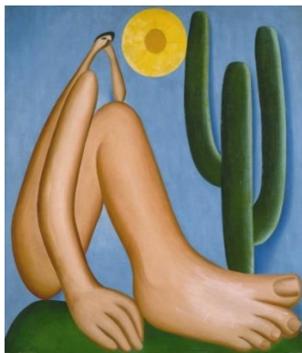
Abaporu, de Tarsila do Amaral

09 Explique a importância da Semana de Arte Moderna, ocorrida no Brasil, São Paulo, em 1922.