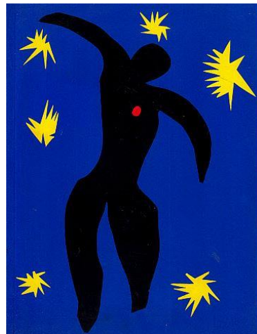
Colagem, Ícaro – Henri Matisse