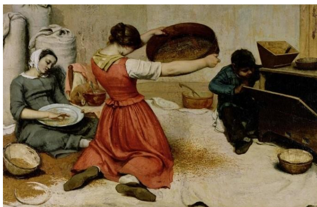
Moça peneirando trigo, Gustave Courbet . (Obra do Realismo)

07 Monet, representava em suas obras os efeitos de luz sobre objetos e as variações provocadas nas cores da natureza. Que importante movimento artístico Monet é considerado o criador?